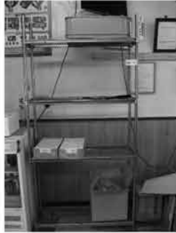
㉕ ステンレスラック