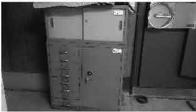
④ ロッカー (下部のみ)