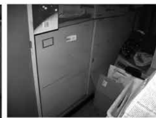
⑮スライドロッカー