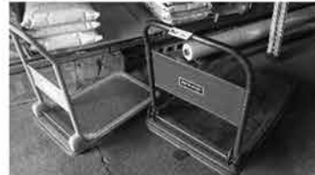
㊷ 台車 3台