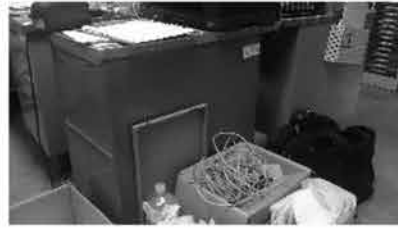
⑤ 袖机 3台