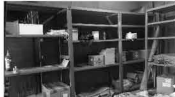
㊶ ラックのみ 5台