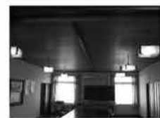
㉟ 吊り下げ電灯 6個