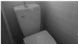
㉘ 洋式便器 2個