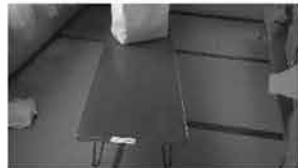
㉝ 座敷机 4本