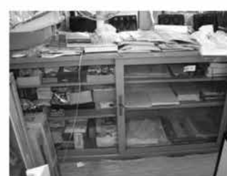
⑬スライドロッカー