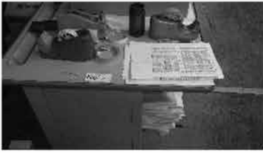
① プリンターテーブル