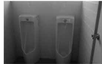
㉗ 小便器 2個