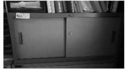
③ ロッカー(小) 2台