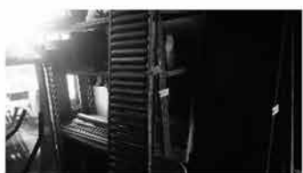
㊸ ローラー㊹ 棚