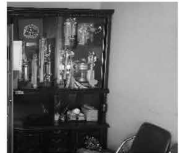
⑫ 木製棚 (中身含まず)