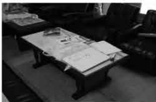
㊺ 応接セット 1セット