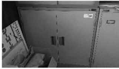
② ロッカー中 8台