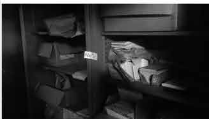
⑬ ラックのみ 2台