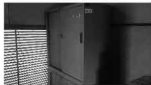
㊲ ロッカー(中) 4台