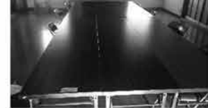
㉛ 長机 23本