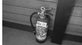
㉚ 消化器 6台