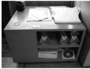
⑳ プリンターテーブル