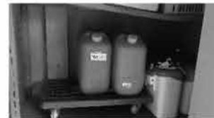
㊴ ポリタンク 2個