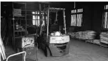
㊵ フォークリフト(最低価格設定有)