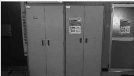
⑦ ロッカー 5台