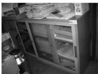
⑭スライドロッカー