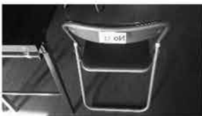
㉜ パイプ椅子 30脚