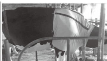
写真1 家畜用衣料の概要